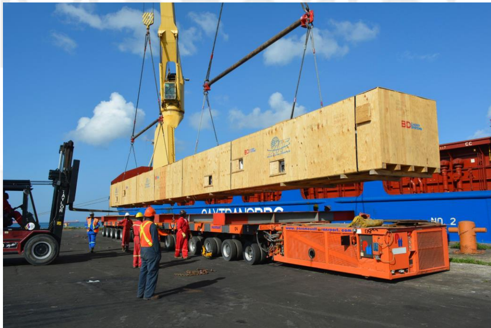
Gráfica 2: Puerto de Point Lisas

El puerto recibe contenedores de carga que provienen desde EE UU, Europa, Reino Unido y el Lejano oriente, los cuales contienen carga a granel seca y líquida. El puerto de Point Lisas es reconocido también porque tiene experiencia en el manejo de cargas de proyecto, es decir cargas pesadas.